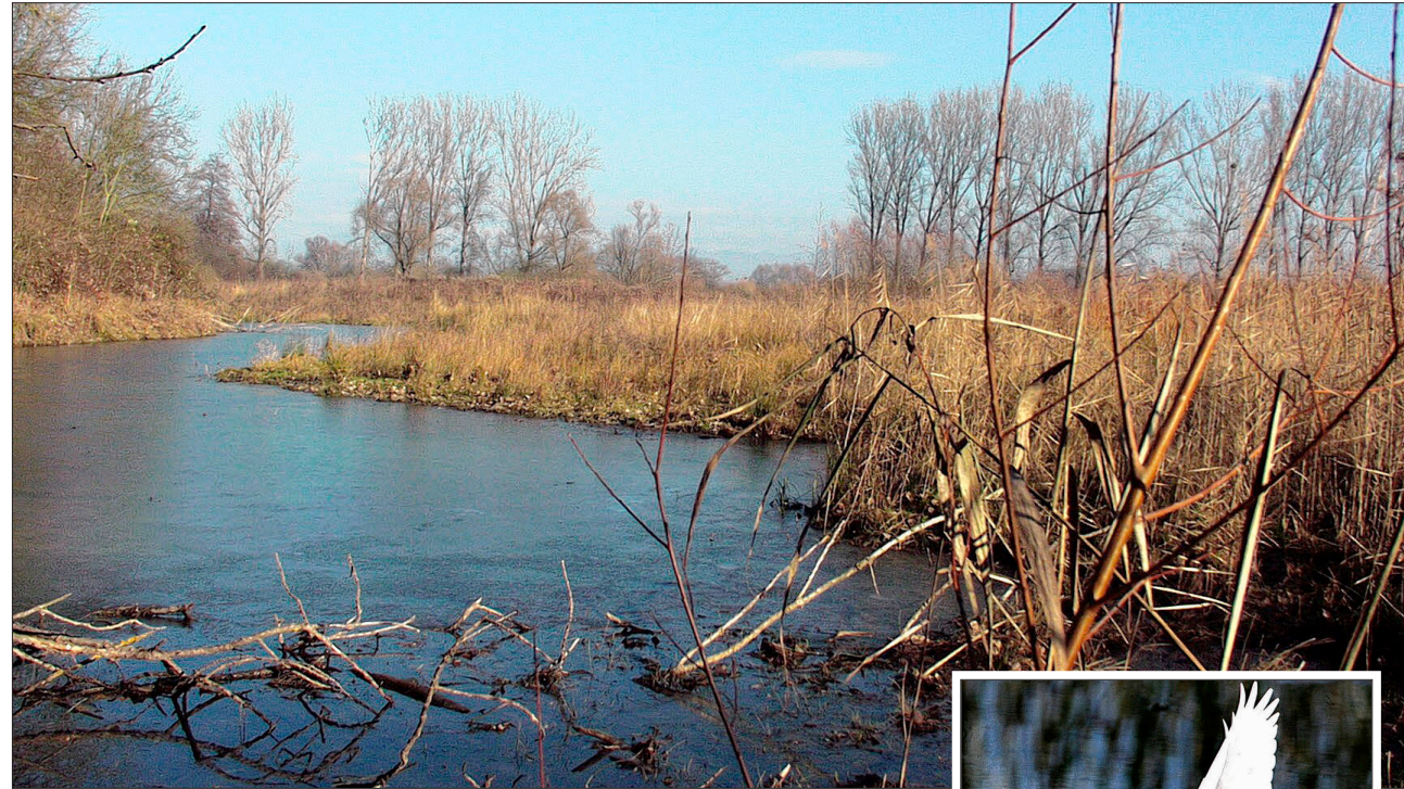
Ursprüngliche Rheinlandschaft bietet die kleine elsässische Camargue – und seltene Tiere wie den Seidenreier (rechts).

Die Mutterfische für die Lachs- zucht lieferten die Rheinfischer.