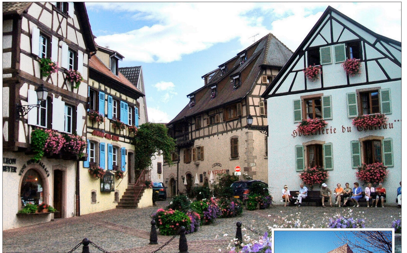
Im Tal unten in Eguisheim elsass-seliges Fachwerk, oben auf den Bergen die Ruinen der Burgen wie Drei Exen oder Hohlandsburg.

Nun haben wir verschiedene Möglichkeiten: Wer nur eine kleine Wanderung machen möchte, geht von der Ruine aus auf dem kleinen Waldweg links (Markierung roter Rhombus) durch einen schönen Eichen-Kastanien-Kiefern-Wald bis in einen Talgrund, das „ Bechtal “. Von dort aus folgt man links dem blauen Rhombus, zuerst weiter durch den Wald, dann durch ein blumenreiches Wiesentälchen und die Weinberge zurück nach Eguisheim. Der Rückblick zu den drei Exen mit ihren markanten Bergfriedern zeigt, was man versäumt hat.