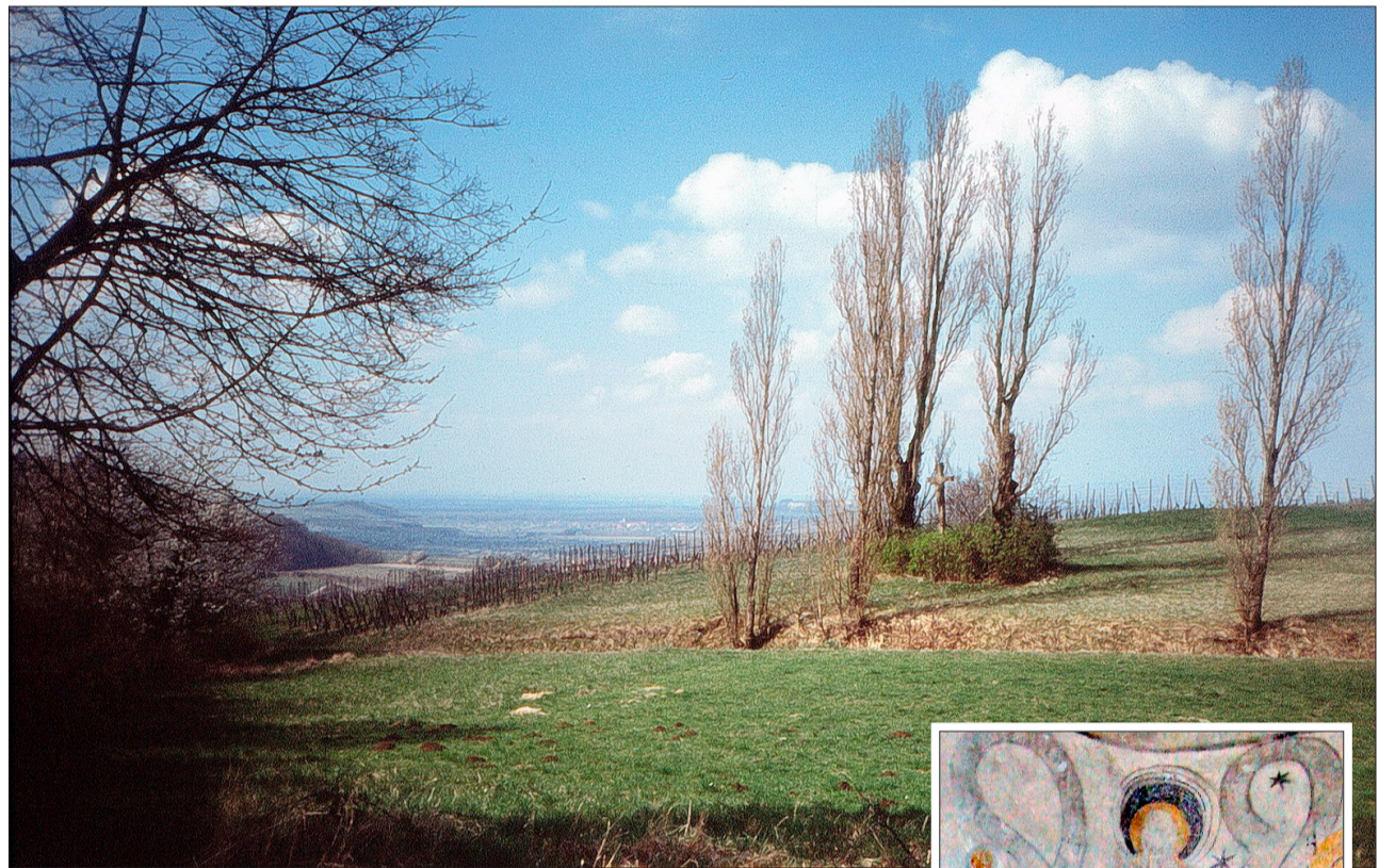
Über die Amolterer Heide (oben) führt der Weg zur Bischoffinger Pfarrkirche St. Laurentius mit dem Weltenbaum (rechts).

Der Wegmarkierung rote Raute auf gelbem Grund folgend, kommen wir auf dem Kamm des Bisam- und des Staffelberges bis zum Kiechlingsberger Eck (3,1 Kilometer). Von dort aus geht es zunächst weiter in Richtung Mondhalde. Nach 800 Metern zweigt beim „Eck“ ein verschwiege-